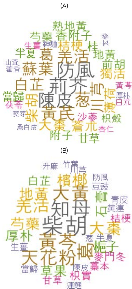
Fig. 3. Word cloud to show the characteristics of medicinal herbs for (A) general cold, (B) epidemic febrile disease.